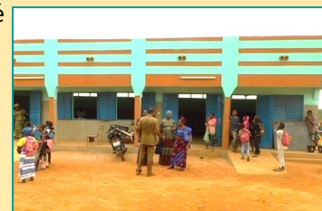
Inauguration à l'école de Colsama

Le nouveau bâtiment de l'école de Colsama a été inauguré en présence du directeur régional de l'éducation de base.