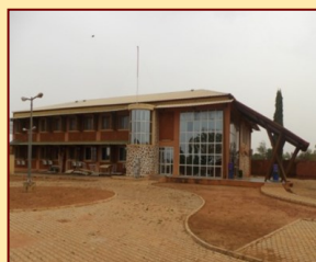
Annexe pédiatrique du CHU de Bobo-Dioulasso