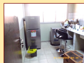
Aménagement du laboratoire d'audioprothèse