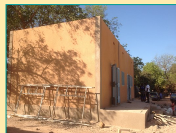
Construction du nouveau « Dispositif Surdité » à l'école de Niéniéta

Des panneaux de signalisation ont été réalisés afin que les « Dispositifs Surdité » des écoles soient bien repérés et identifiés.