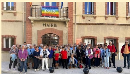
➤ Fête du jumelage à Alénia

Par un temps radieux nous avons accueilli nos amis de Celrà. Super journée avec repas, concours de pétanque, sardanes et un magnifique spectacle de rue.