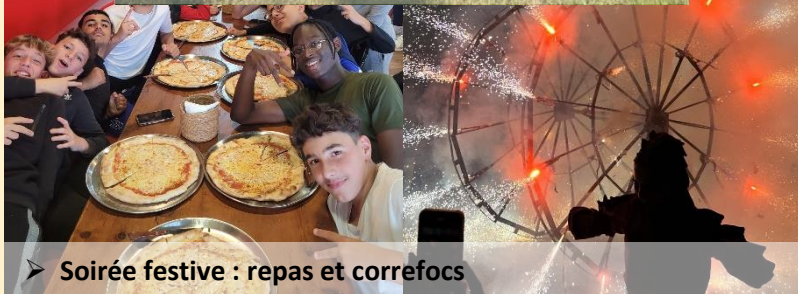
➤ Soirée festive : repas et correfocs