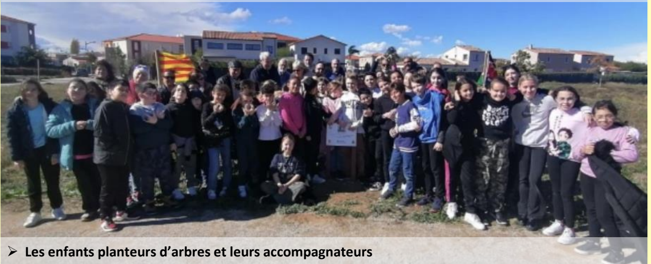
➤ Les enfants planteurs d'arbres et leurs accompagnateurs

Les 4 et 8 mars, dans le cadre du projet d'éducation à la citoyenneté mondiale du dispositif « Tandems Solidaires », le Comité de jumelage a invité les écoliers et les jeunes du Service jeunesse d'Alénia à planter 70 arbres très peu gourmands en eau. Des oliviers, micocouliers, grenadiers, frênes et tilleuls apporteront désormais leur fraîcheur au Pumptrack et sur la Voie verte. Cet événement vise à sensibiliser les enfants à l'importance de la protection de l'environnement et à les engager concrètement dans la lutte contre le changement climatique.