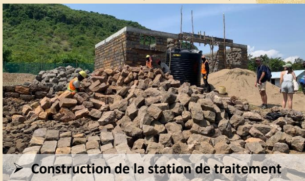
➤ Construction de la station de traitement

Le réseau de distribution a démarré en juillet pour une mise en service fin octobre après avoir réalisé les différents tests de pression et de potabilité.