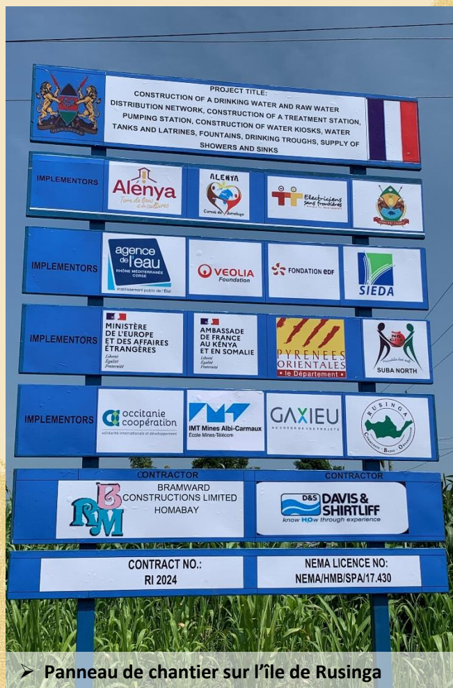
➤ Panneau de chantier sur l'île de Rusinga