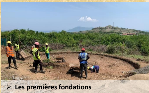
➤ Les premières fondations

Ils ont participé à la mise en place d'un comité de gestion local de l'eau qui établira un règlement de l'usage de l'eau, procèdera au recrutement du personnel nécessaire au bon fonctionnement des installations, assurera sa rémunération ainsi que la gestion des revenus générés par la vente de l'eau.