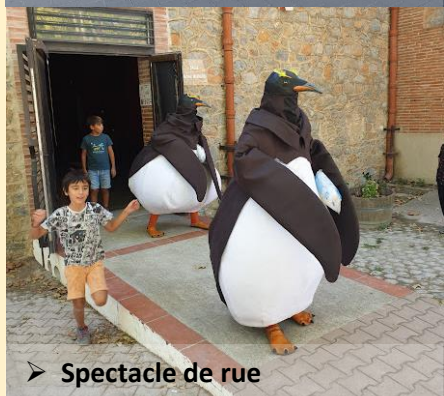
➤ Spectacle de rue