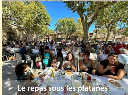
➤ Le repas sous les platanes