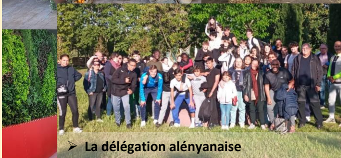
➤ La délégation alényanaise