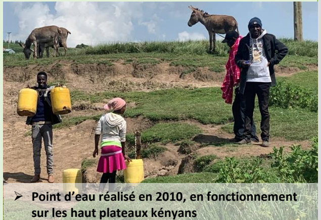
➤ Point d'eau réalisé en 2010, en fonctionnement sur les haut plateaux kenyans

Entre 2002 et 2022, les inondations ont tué plus de 100 000 personnes, les sécheresses ont touché plus de 1,4 milliard de personnes. Ces catastrophes devraient en outre s'amplifier avec l'accroissement du réchauffement climatique qui va inévitablement intensifier le cycle de l'eau sur la planète d'ici 2050.