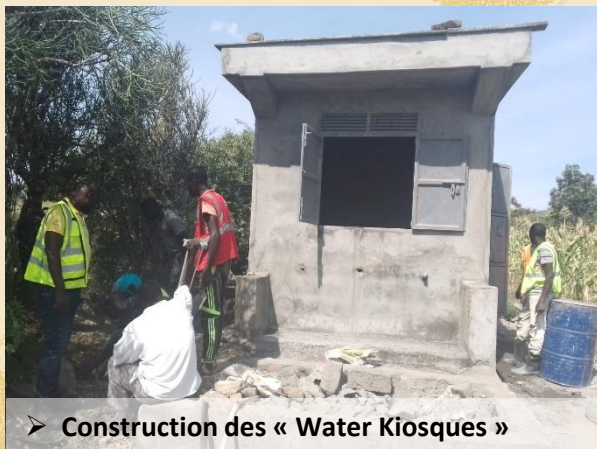
➤ Construction des « Water Kiosques »

Une mission jeunes « chantier solidaire », composée de membres du Point jeunes d'Alénya se déplacera au Kenya en février 2025, afin de réaliser des actions solidaires dans les 4 écoles concernées par le projet.