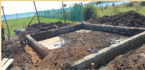
➤ Construction de la station de pompage

Les travaux pour la station de pompage, réalisée par Electriciens Sans Frontières, ont démarré en juin et devraient se terminer en octobre.