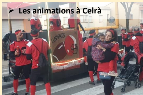
➤ Les animations à Celrà