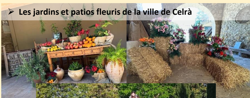
➤ Les jardins et patios fleuris de la ville de Celrà

Encore une fois un bus d'Alénia s'est rendu à Celrà pour la traditionnelle soirée des Correfocs et la visite des jardins fleuris. Belle journée pour les jeunes et moins jeunes.