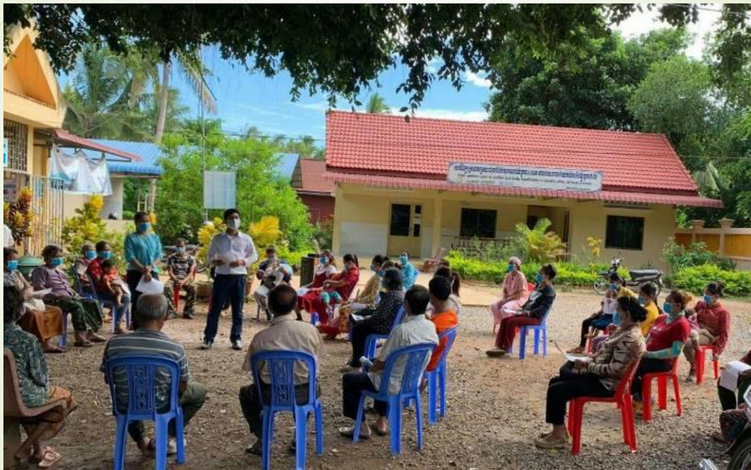
Sensibilisation des populations dans 6 Centres de Santé